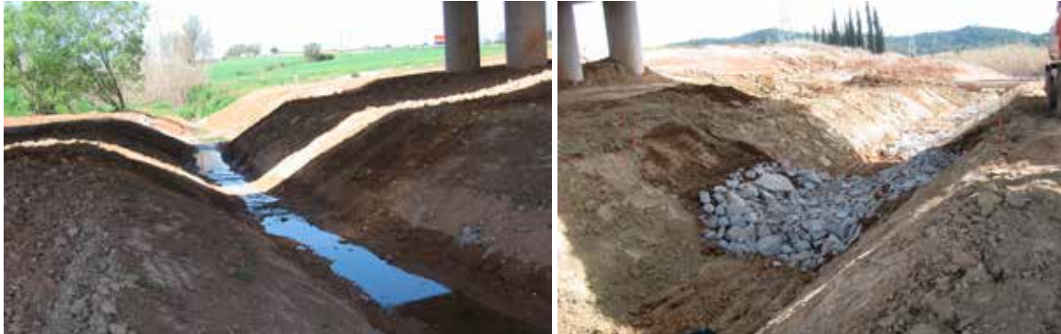
Figura 3 Llera del torrent de Can Fatjó sota el viaducte de la carretera BP-1413 . A dalt secció longitudinal de la llera sota el viaducte. A la foto de l'esquerra s'observa la secció de la llera restituïda i en la foto de la dreta l'execució de la protecció realitzada.

En el cas del Torrent del Bosc, com ja s'ha dit, el nou traçat en planta de la carretera desplaçat cap al nord respecte del traçat que es modificava, per tant, calia desmuntar els terraplens de l'antiga carretera i enderrocar la OD per tal de poder restaurar la funcionalitat del torrent com a corredor faunístic. La OD era una estructura de formigó en massa amb molt poc armat i molt gruixuda (de 60 cm a 1 m).