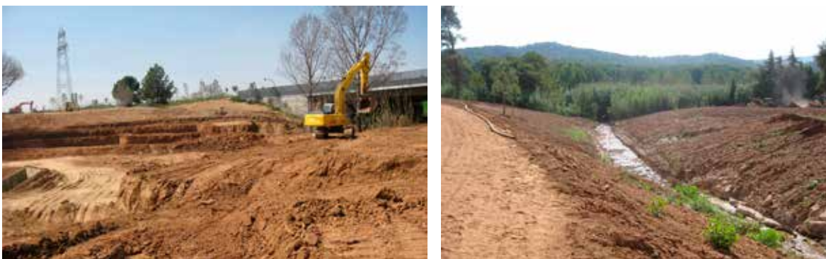
Figura 5 Remodelació topogràfica de la llera del torrent del Bosc. A la foto de l'esquerra (al fons) s'observa el viaducte de 30 m d'amplada i a l'esquerra encerclat en vermell, encara es pot veure el brocal de l'obra de drenatge preexistent abans de la seva demolició. En la foto de la dreta, es veu una vista general de la llera restituïda abans de dur a terme les revegetacions.

Com ja s'ha comentat en el capítol anterior, en ambdós casos va ser necessària la restitució d'una llera prèviament inexistent en aquest tram de torrent, pel qual va ser necessari realitzar la remodelació topogràfica dels entorns dels torrents donant els pendents adequats per a la seva correcta revegetació, garantint la integració paisatgística de la llera i alhora la seva protecció davant l'erosió.