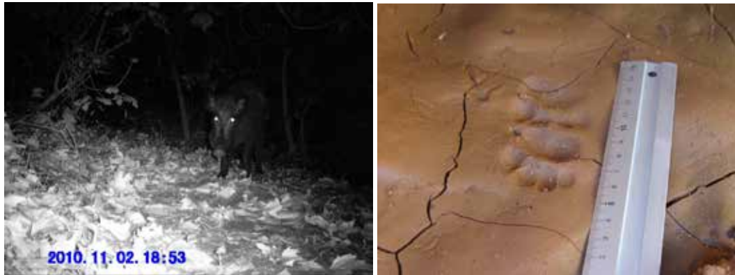
Figura 8 A la foto de l'esquerra s'observa un senglar detectat al torrent de Can Fatjó, mitjançant equips de fototrampeig. En la foto de la dreta petjada de teixó localitzada al torrent del Bosc.