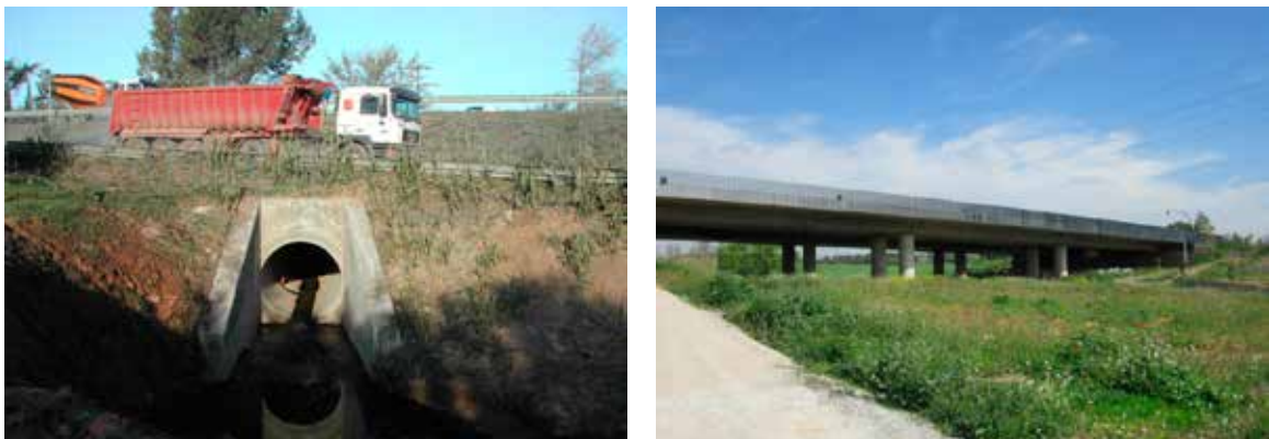
Figura 1 Carretera BP-1413 al torrent de Can Fatjó. A l'esquerra (en primer terme) s'observa el drenatge de 1,5 m de diàmetre existent abans de l'execució de les obres previstes en el projecte del Corredor Verd del Parc de l'Alba. A la dreta es mostra el viaducte de 125 m d'amplada existent en l'actualitat.

El projecte de la carretera va preveure el pas sobre els torrents amb dues estructures dissenyades per a l'ús mixt de la fauna, persones, camins de servei i els torrents. Es tracta de la construcció de dos viaductes de 125m i 30 m d'amplada, que substitueixen antics drenatges de tipus circular de 1,5 m de diàmetre i volta de 3 m d'amplada, respectivament (veure figures 1 i 2).