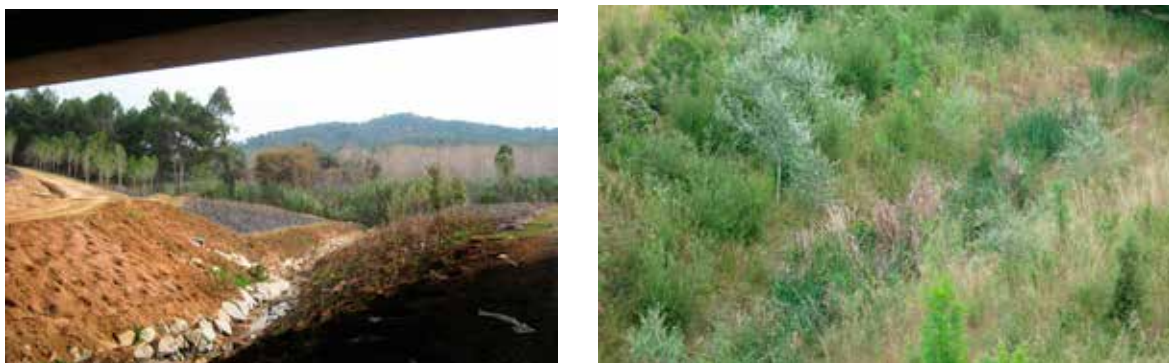
Figura 7 Llera del torrent del Bosc restaurada. A la foto de l'esquerra s'observen les plantacions just realitzades a la tardor i hivern 2011 sota el viaducte. En la foto de la dreta vista general de l'estat de la vegetació de ribera a la primavera de 2014.