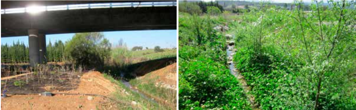
Figura 6 Llera del torrent de Can Fatjó restaurada. A la foto de l'esquerra s'observa el moment de fer les plantacions sota el viaducte (primavera i tardor 2011). A la foto de la dreta s'observa l'estat de les sèmres i plantacions a la primavera de 2012. Fotos: Consorci Centre Direccional Cerdanyola.