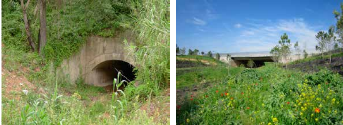
Figura 2 Carretera BP-1413 al torrent del Bosc. A la foto de l'esquerra (al fons) s'observa la volta de 3 m d'amplada existent abans de l'execució de les obres previstes en el projecte del Corredor Verd. A la dreta s'observa vista general del viaducte de 30 m d'amplada existent en l'actualitat.