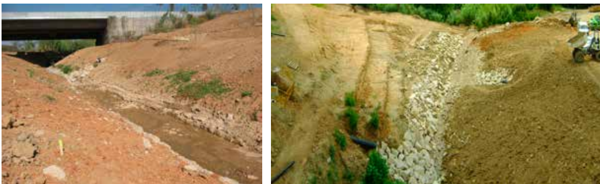
Figura 4 Llera restituïda del torrent del Bosc.. A la foto de l' esquerra estat de la llera restituïda sota el viaducte de la carretera BP-1413. En la foto de la dreta l'estat de la llera restituïda aigües avall del viaducte i abans de la seva afluença a la riera de Sant Cugat.